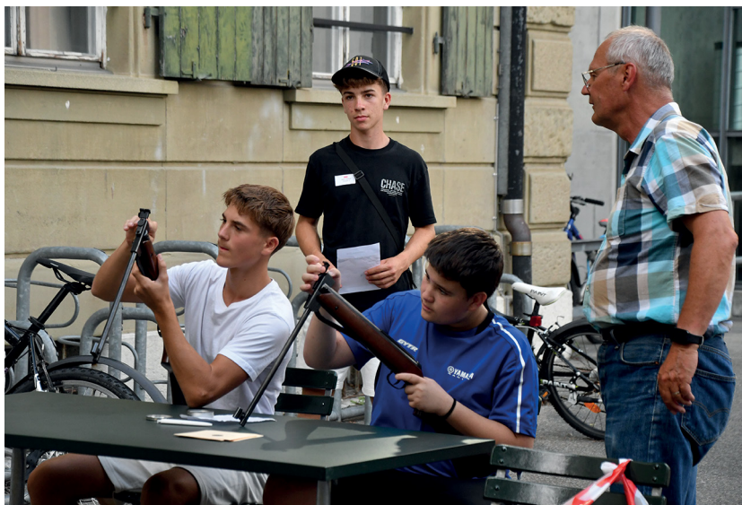
Die «Grossen» schiessen um den Pokal.