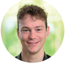
Autor: Lorenz Hofmann

Dank der Unterstützung der Gesellschaft zu Kaufleuten konnte ich ein Austauschsemester an der Aalto University in Helsinki absolvieren – eine prägende Erfahrung, akademisch wie persönlich.