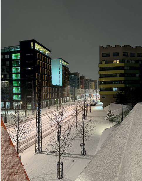
Mein Zuhause - der Stadtteil Jätkäsaari Mitte März