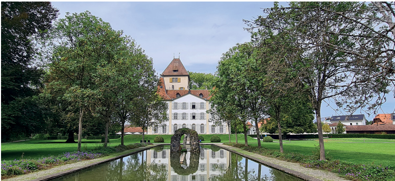
Der barocke Karpfenteich im Schlosspark.

Der Kulturanlass vom 13. September 2025 führte uns ins Schloss Jegenstorf – ein Ort mit bewegter Vergangenheit und charmantem Ambiente.