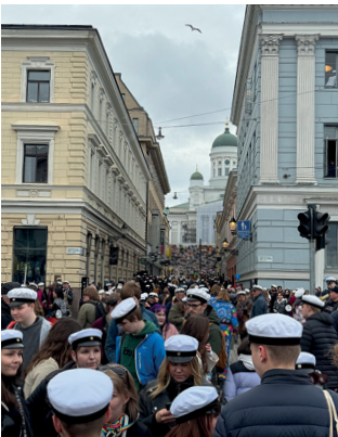
Der Dom von Helsinki an «Vappu»

Dank der Unterstützung der Gesellschaft zu Kaufleuten konnte ich ein Austauschsemester an der Aalto University in Helsinki absolvieren – eine prägende Erfahrung, akademisch wie persönlich.