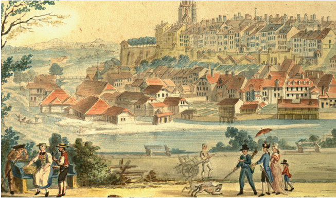
Blick auf die Matte mit der Stadtmühle (grosses Gebäude am linken Bildrand). Burgerbibliothek Bern, Gr.D.159

an andern Orten Pulver herzustellen. Die Spezereistampfe, in der ein Pächter die Gewürzpulver herstellte, befand sich im Gebäude der Stadtmühle an der Matte. In diesem Zusammenhang finden sich im Gesellschaftsarchiv auch noch Pulverrezepte. Nach dem Verlust des Monopols 1804 rentierte die Stampfe immer weniger, so dass Kaufleuten sie 1819 an die Stadt verkaufte.