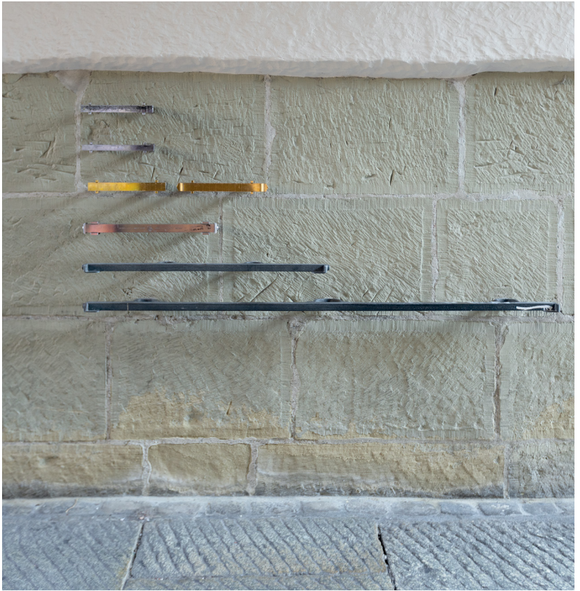
Längenmasse für den Marktgebrauch – seit dem 17. Jahrhundert am Zytglogge angebracht.