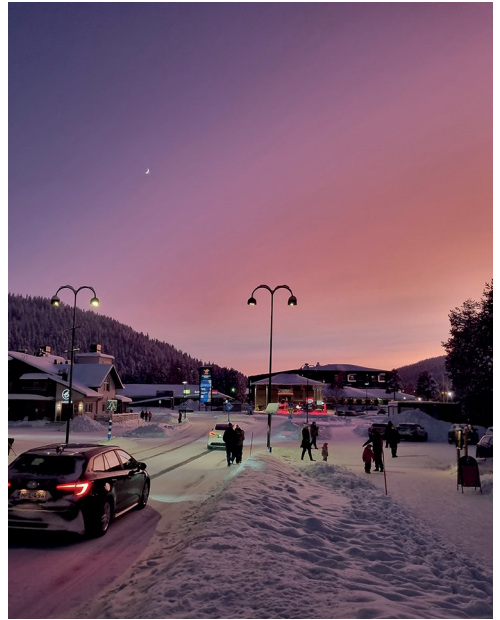
Sonnenuntergang in Levi, Lappland

anders als die zurückhaltenden Stereotypen, die ich zuvor mit Finnland verbunden hatte. Zahlreiche Vereine organisieren regelmässig Events, Partys und Reisen für Studierende. Besonders eindrücklich war das Maifest «Vappu», bei dem Studierende die ganze Stadt übernehmen und Helsinki für einen Tag in eine einzige grosse Feier verwandelten.