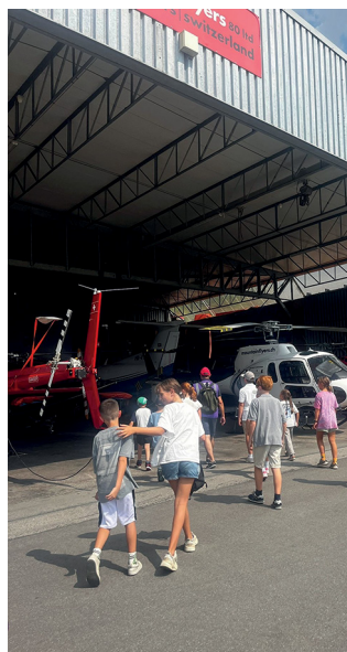
... auf dem Flughafen Bern Belpmoos.