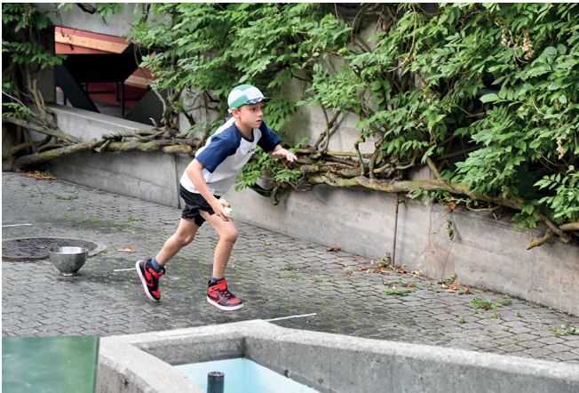
Spiel und Spass auf dem Campus Muristalden.