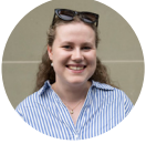
Autorin: Lina Moser

Entdecke das Jahresprogramm der Jungen Burgergemeinde und sei dabei, wenn wir gemeinsam frischen Wind in die Burgergemeinde bringen.