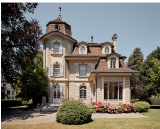
Elfenstrasse 19 heute