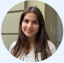
Autorin: Giulia Frösch