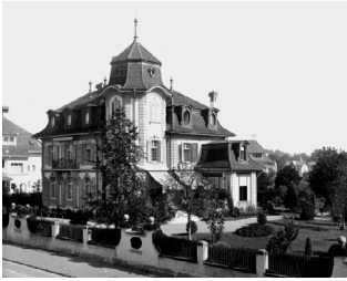
Elfenstrasse 19 nach 1905

Die Villa an der Elfenstrasse prägt gekonnt den Stil des Berner Dix-huitièmes. Ihr Turm und die bewegte Dachlandschaft spiegelt den romantischen Zeitgeist wider.