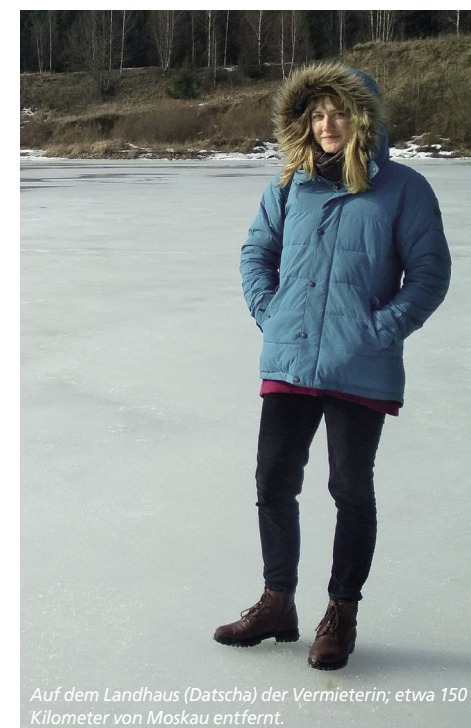
Auf dem Landhaus (Datscha) der Vermieterin; etwa 150 Kilometer von Moskau entfernt.

Mit seinen unzähligen Museen, Galerien, Konzerthallen und Kulturzentren hat Moskau ein unglaublich reiches kulturelles Leben. Überwältigend war für mich ebenso die vielfältige Architektur. Alles in allem besitzt Moskau eine besondere Atmosphäre, die sich schwer beschreiben lässt. Für mich zeichnet sie sich durch ihre Widersprüchlichkeit aus. Die Stadt ist abweisend und einladend zugleich, melancholisch und fröhlich, desillusionierend und inspirierend. Und jeden Tag wird man auf irgendeine Art und Weise überrascht.»