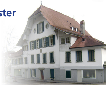
Das Glurhaus an der Weihergasse 17