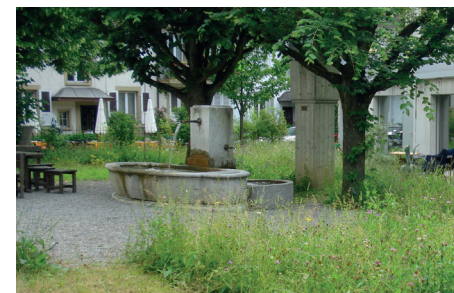
Brunnen im Garten hinter dem Glurhaus

Zu seinen Aufgaben zählt auch das Führen des Kontrollblatts. So dient ihm mitunter auch das Wasser, welches aus dem grossen Brunnen hinter seinem Haus fliesst, zur Kontrolle. An diesem Standort misst René Hell die Wassertemperatur der Glur-Quelle. Diese bewegt sich im Jahresverlauf zwischen 11 und 17 Grad.