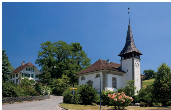
Albligen Dorfzentrum mit Kirche

Weiter geht's in leichtem Abstieg zur Pumpstation «Birchholz», stets das Mittelland bis hin zum Jura vor Augen. Nach ca. 50 Minuten erreichen wir Ueberstorf, das Postauto führt uns nach Flamatt und der Zug nach Thörishaus. Hier treffen wir im Gasthof Sternen auch jene Leute, welche zum feinen Zvieri direkt von Bern angereist sind.