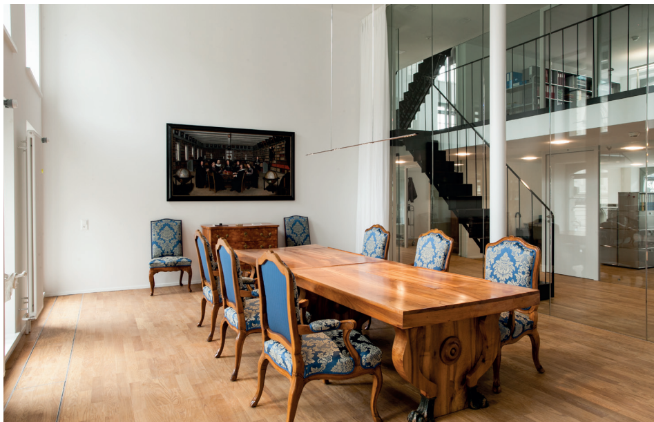
Sitzungszimmer Burgerbibliothek