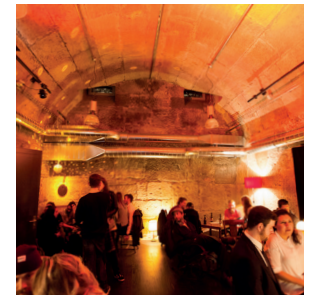
Im Kellergewölbe des Burgerspitals