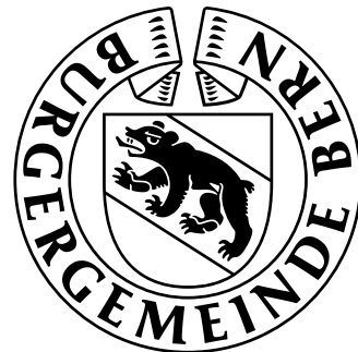
Gaststadt Bern 3. – 12. Mai 2013