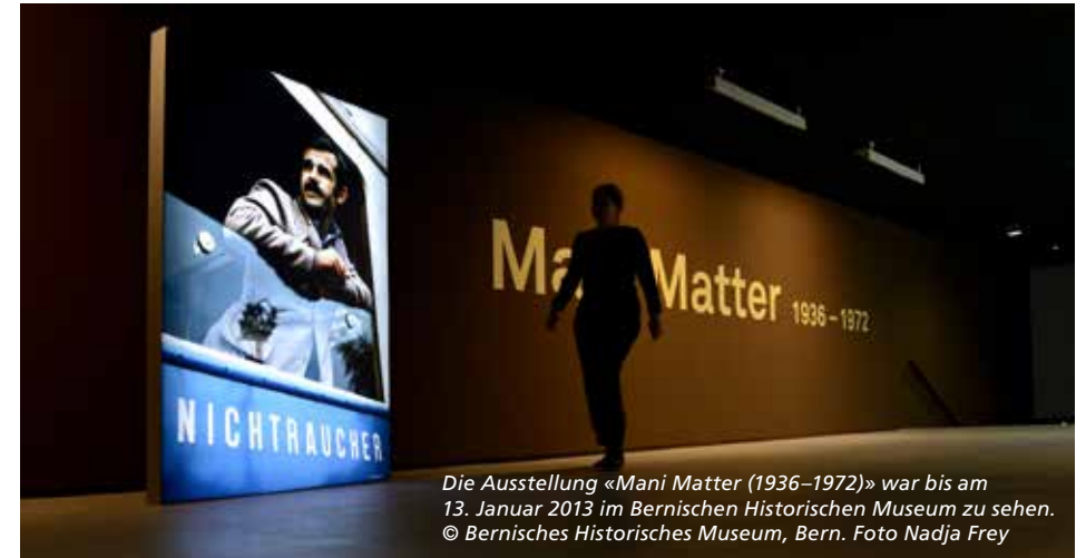
Die Ausstellung «Mani Matter (1936–1972)» war bis am 13. Januar 2013 im Bernischen Historischen Museum zu sehen.

Besuch der Mani-Matter-Wechselausstellung im Bernischen Historischen Museum – ein Erlebnis zwischen Faszination und metaphysischem Gruseln.