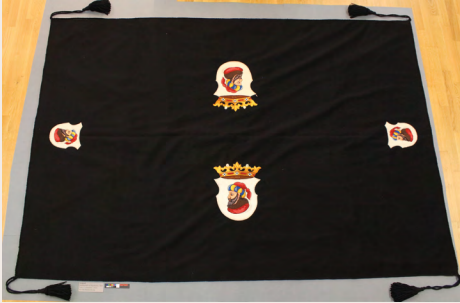
Das Sargtuch der Gesellschaft zu Kaufleuten aus dem Jahr 1939.