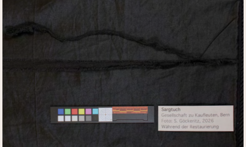
118 cm Riss im Futterstoff auf der Rückseite des Sargtuchs.

Ihr Atelier liegt unscheinbar am Eingang des Köniztals. Beim Betreten fühlt man sich fast wie in einem Operationssaal: helle Lampen, konzentrierte Stille, Nadeln und Fäden, Stoffproben und Werkzeuge – und mittendrin unser aufgespanntes Sargtuch. Der zu bearbeitende Bereich wurde mit feinen Insektennadeln auf einer Platte aufgesteckt und so für die Nähssicherung vorbereitet. Daneben warteten weitere «Patienten» auf ihre Bearbeitung: ein Toramantel, eine Tapisserie und sogar Teile einer Samurai-Rüstung. Das Berufsfeld der Textilrestauratorin ist überraschend vielfältig.