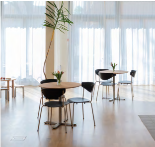
Das neue Quartierzentrum Nord an der Wylerringstrasse 58.

Die Gesellschaft zu Kaufleuten unterstützt den Ausbau des neuen Quartierzentrums Nord mit einem finanziellen Beitrag und setzt damit ein Zeichen für sozialen Zusammenhalt und gelebte Nachbarschaft in Bern