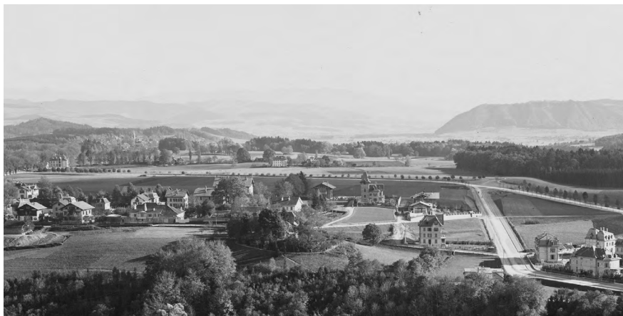
Bild rechts: Die Jungfraustrasse 2/4 im Zustand von 1933, noch mit einer einheitlich roten Fassade.

Im Jahr 1984 schenkte das Ehepaar Biedermann der Gesellschaft die Liegenschaft Jungfraustrasse 4. Die 1894 fertiggestellte Doppelvilla Jungfraustrasse 2/4 gehört zu einer frühen Überbauungsphase des Kirchenfelds. Der Architekt Eugen Stettler (1840-1913) führte sie im Neurenaissance-Stil aus. Sie war das erste Gebäude an der Jungfraustrasse, die von unten nach oben bebaut wurde. Im Gegensatz zu Nr. 2 ist bei Nr. 4 noch die ursprüngliche rote Fassade erhalten. Erste Besitzerin der Villa Nr. 4 war Rosina Biedermann (1839-1904), Witwe des Kreispostkassiers August Biedermann und Angehörige von Kaufleuten. Im Jahr 1996 gab Kaufleuten das Terrain im Baurecht ab.